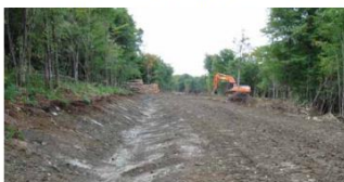
Photo 1 : Fossé de forme parabolique. Pratique exemplaire avec un fond suffisamment large pour éviter l'écoulement concentré et avec des pentes de talus stables.

Les fossés doivent avoir une forme parabolique (Photo 1) avec une pente maximale des talus de 2H:1V (Figure 3, 1) et une profondeur maximale de 0,6 m (2 pi) (Figure 3, 2). Ces fossés doivent être creusés de côté par une pelle mécanique équipée d'un godet rond (Figure 3, 3);