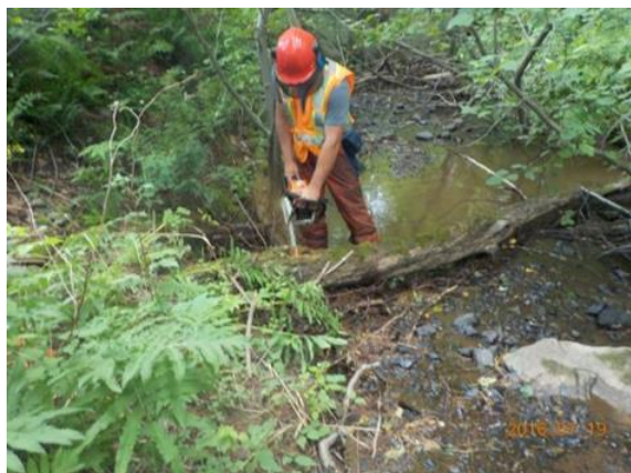
Nettoyage et identification de foyers d'érosion dans le cadre du plan directeur.

Suite à toutes ces études, la réalisation d'un plan directeur du lac Bromont s'avère nécessaire afin de mettre en place des mesures correctives concrètes.