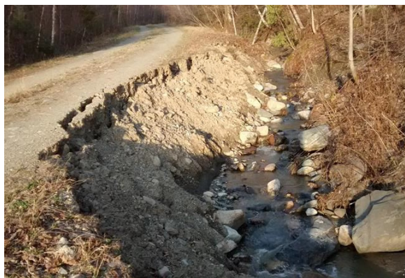
Chemin forestier mal aménagé dans une pente de 7 %. Détérioration du chemin due à l'érosion et coûts de réparation importants à prévoir.

La formation se déroule sur une journée. Un bloc théorique en matinée, en salle et d'une durée d'environ trois heures vous introduit aux différentes techniques retrouvées dans le guide. Un bloc pratique en après-midi vous amène sur le terrain. En ce qui concerne le bloc pratique, vous pouvez choisir entre deux options : une étude de cas concret d'érosion sur le terrain ou une formation axée sur des exercices pratiques avec de la machinerie. Dans l'étude de cas concret, vous avez l'opportunité de visiter au moins deux sites problématiques, d'être questionnés sur les causes du problème et sur les bonnes techniques à utiliser pour corriger celui-ci. La formation axée sur des exercices pratiques vous permet d'expérimenter de cinq à six techniques novatrices sur un site préalablement déterminé. Les sites sont choisis par les participants et approuvés par les formateurs.