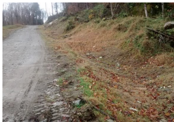
Chemin forestier aménagé dans une pente de 18 % en utilisant les techniques adéquates de contrôle de l'érosion. Le seul coût d'entretien à prévoir est le débroussaillage des fossés dans quelques années.