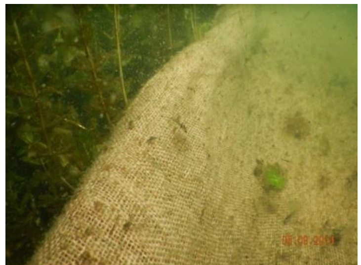
Photo: Prise de vue sur une toile de jute recouvrant les herbiers au fond du lac

Le myriophylle à épi est une espèce de plante aquatique exotique et envahissante dont la prolifération excessive peut causer des répercussions négatives sur l'environnement. En effet, les impacts environnementaux, sociaux et économiques de cette espèce à caractère envahissant sont bien connus et bien documentés. Au niveau environnemental, le myriophylle à épi est reconnu pour causer de graves changements dans les communautés aquatiques en affectant des espèces de poissons qui ont un intérêt pour la pêche sportive et en altérant la composition des sols des lacs et le cycle des nutriments. L'invasion de ces herbiers cause aussi des désagréments pour les activités récréotouristiques et rend difficile les activités telles que la nage et le canotage. De plus, la présence du myriophylle à épi devant une propriété riveraine peut rendre cette dernière moins intéressante sur le marché foncier.