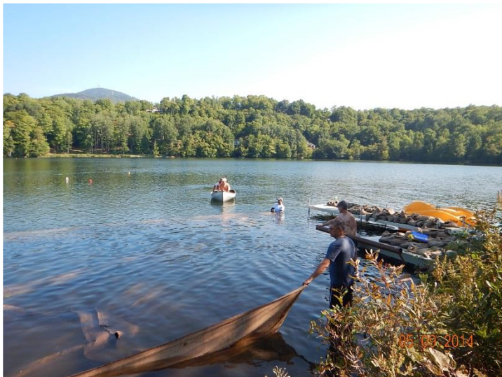
Photo: Les employés du RAPPEL et les riverains au travail

Au cours des prochaines années, le projet prévoit l'ajout de toiles supplémentaires afin d'atteindre une superficie totale de 7 200 m 2 . Un programme de suivi a également été mise sur pied de façon à documenter l'efficacité de cette méthode dans le temps. De plus, un suivi faunique et floristique sommaire sera effectué trois fois par année tout au long de la durée du projet.