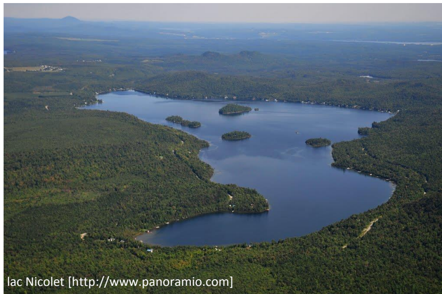
lac Nicolet [ http://www.panoramio.com ]

Même si le lac Nicolet est considéré comme un lac en bonne santé, soit oligotrophe, les membres de l'association sont conscients que cet équilibre fragile peut être facilement brisé par différents facteurs. C'est pour maintenir cet équilibre que les membres de l'association voient au suivi rigoureux de la qualité de l'eau de leur lac. C'est aussi dans une optique de prévention que l'association des résidants du lac Nicolet a mandaté le RAPPEL pour effectuer le diagnostic environnemental du bassin versant du lac Nicolet. Pour terminer, l'association est fière d'avoir reçu le SECCHI D'OR remis par le Réseau de surveillance volontaire des lacs (RSVL) pour leur participation exemplaire et leur travail assidu dans les mesures de transparence de l'eau.